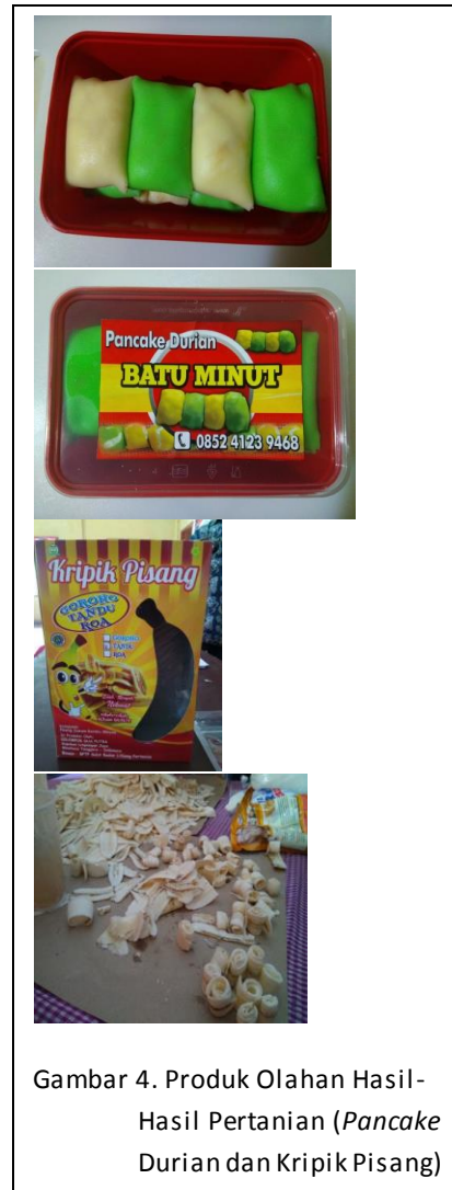
Gambar 4. Produk Olahan Hasil-Hasil Pertanian ( Pancake Durian dan Kripik Pisang )

durian, keripik pisang, dan pengembangan pupuk organik merupakan target capaian tim IbW pada tahun I ini.