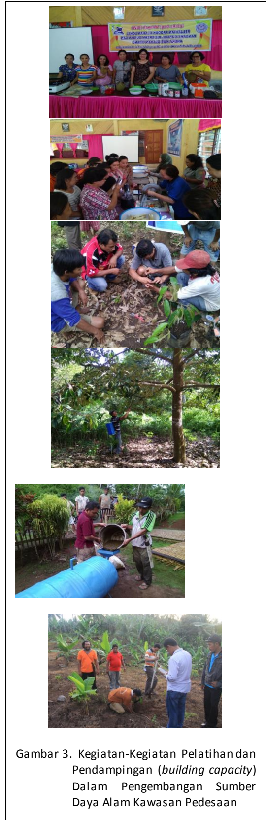
Gambar 3. Kegiatan-Kegiatan Pelatihan dan Pendampingan ( building capacity ) Dalam Pengembangan Sumber Daya Alam Kawasan Pedesaan