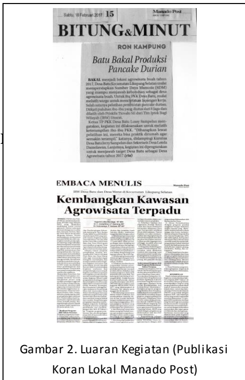
Gambar 2. Luaran Kegiatan (Publikasi Koran Lokal Manado Post)

Berdasarkan permasalahan kelompok mitramaka metode pelaksanaan kegiatan pengabdian kepada masyarakat dilakukan dengan cara pembinaan dan pendampingan terhadap kelompok tersebut. Pembinaan dan pendampingan yang dilakukan untuk menangani beberapa masalah prioritas diantaranya seperti tertera pada tabel 1 dan gambar 3 di bawah ini :